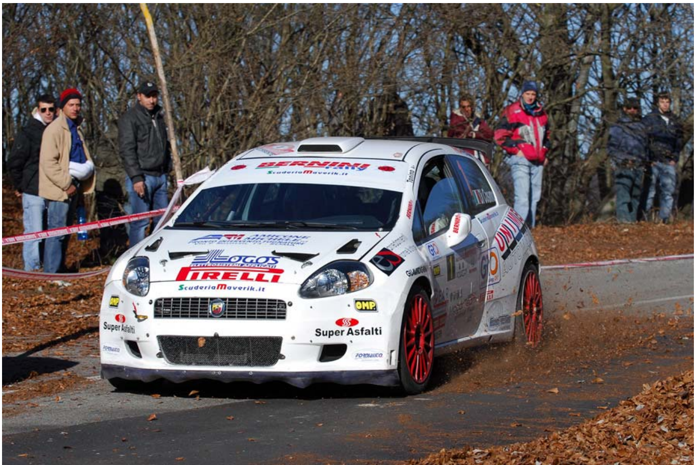
I vincitori della Coppa Italia 2008 Di Cosimo - Crescenzi con la Grande Punto Abarth