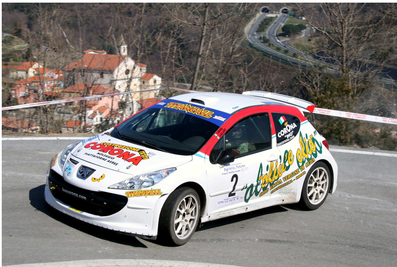
I vincitori Corona-Gagliardi su Peugeot 207 Super 2000

Imperia ha ricevuto il premio Beppe "Kamikaze" Simula, mentre De Marchi-Poggi si sono visti consegnare il premio dedicato alla memoria di Gianfranco Viglizzo, riservato ai primi classificati tra le omologazioni scadute.