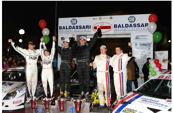
Il podio della gara