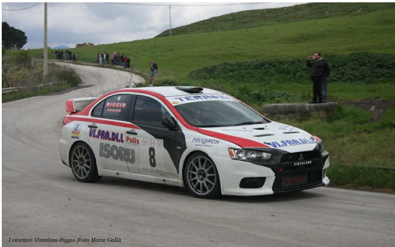
I vincitori Vintaloro-Riggio

La Ronde dello Jato, organizzata dall'Associazione Sportiva Aquila Onlus di Alcamo, e patrocinata dalle amministrazioni comunali di San Cipirello e Roccamena con il sostegno dell'Assessorato Regionale Sport, Turismo e Spettacolo, della Provincia Regionale di Palermo, e della Banca di Credito Cooperativo Don Rizzo, si è disputata su un percorso lungo 191,77 km, 41,20 costituiti dalle quattro prove speciali.